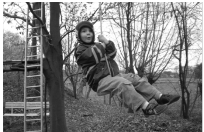
Bild 6: Selbstwirksamkeit und Eigen-Sinn: nicht nur in die Drahtseilbahn gesetzt und gefahren werden, ...

Ein entscheidendes Kriterium der intermediären Räume [Winnicott 1979] mit ihren Anschlussmöglichkeiten an die frühen Spuren im Gedächtnis der Liebe ist deren Zwanglosigkeit. Hier verbindet sich der eben genannte kindliche Eigen-Rhythmus aus den Lächelspielen mit dem kindlichen Eigen-Sinn und Selbstwirksamkeitsbedürfnis: selber etwas machen, nicht nur passiv etwas arrangiert bekommen. Zum Beispiel: nicht nur in die Drahtseilbahn gesetzt und gefahren werden, sondern selber den Wau-Wau mit der Seilbahn fahren lassen und Seilbahnwärter sein. Selbstwirksamkeit 1 ist eine wunderbare salutogene Erfahrung: „ Schau her, ICH kann etwas gestalten. Können wir uns da nicht zusammen freuen?! “ [Schiffer 2013] (Bilder 6-8).