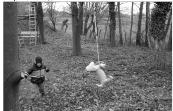
Bild 7: ...sondern selber den Wau-Wau mit der Seilbahn fahren lassen ...