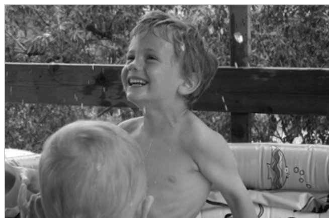
Bild 4: ... entstehen Augenblicke der Begegnung – voller Lebensfreude.

voll angenommen erlebe. Daraus resultiert die Sicherheit nicht allein, sondern für andere bedeutungsvoll, nämlich „ein wertvolles Geschenk“ [Krause 2002] zu sein.