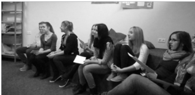
Bild 15: ... mit wertschätzender Wahrnehmung.