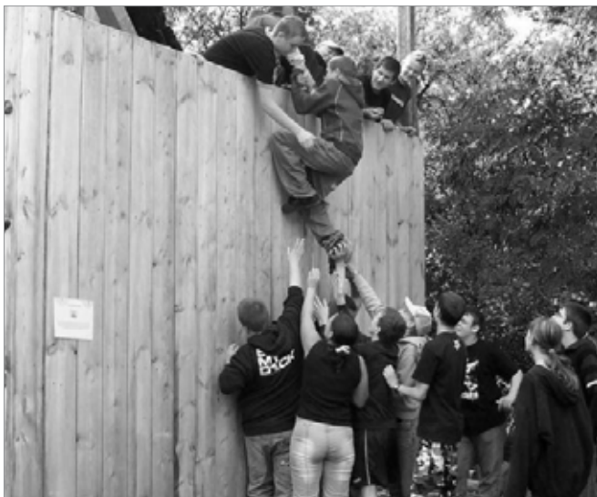
Bild 5: Miteinander