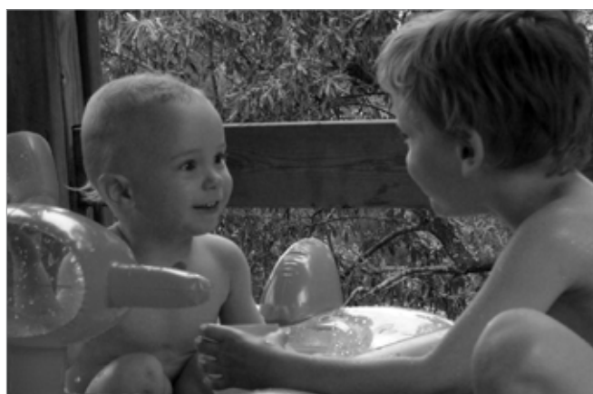
Bild 3: ... auch mit anderen erfährt: „Schön, dass es Dich gibt!“, ...