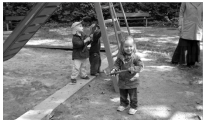
Bild 4: Das Mädchen tanzt zum Rhythmus, die „Boy-Group“ macht den Hintergrund-Sound. Das Kind der Muslimin schaut zu seiner Mama, ob das wohl alles so in Ordnung ist. Die Mama nickt freundlich lächelnd.