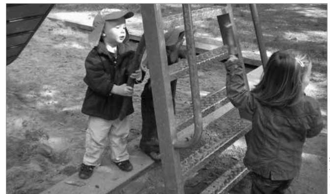
Bild 2: „Peng, Peng“, so zwei Jungen mit ihren „Knüppelgewehren“. „Dong, Dong, Dong“, so das Mädchen am „Schlagzeug“.