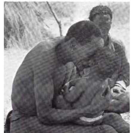
Bild 9: Lächelspiele als anthropologische Konstante: Eine solche Begegnungsweise stellt wohl in allen Kulturen ...