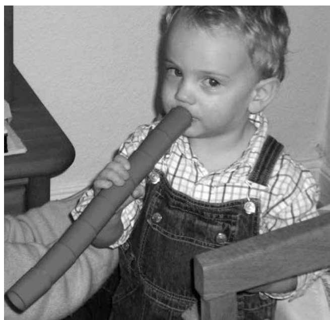
Bild 1: Erstes spontanes Flötenskonzert: „Best of Christmas Songs“

andächtig zu. Eines Abends signalisiert er nach dem Flötenspiel jedoch nicht – wie sonst zu erwarten gewesen wäre – sein Einverständnis, jetzt ins Bett gebracht zu werden („Ohne zu meckern!“) Vielmehr zerlegt er in Windeseile seine Kugelbahn, fügt mehrere kleine Rohre zu einem längeren Rohr zusammen und stellt sich damit vor den Notenständer. Dann summt er in dieses Rohr die ihm geläufigen Melodieteile von Weihnachtsliedern und bewegt die Finger dazu wie Opa beim Flötenspiel (Bild 1). Nach einigen Takten dreht er sich um, schaut gespannt in die Runde und beginnt zu strahlen, als er die freudigen Gesichter der applaudierenden Zuhörerinnen und Zuhörer sieht.